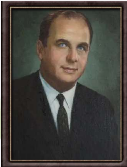
SENATOR GAYLORD NELSON

In 2016, it was on Earth Day that the famous Paris Agreement was signed, which is a global commitment by nations to fight climate changes.